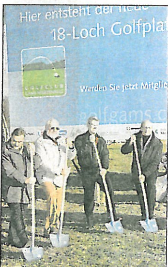
In Rekordzeit zum Golfplatz: Schweizer Betreiber.

Jahres sollen die ersten Bälle fliegen. Während hierzulande wie beispielsweise im Rankweiler Weitried die Gegner mit Argusaugen die Bagger verfolgen und von Naturschützern Höchstgerichte angerufen werden, ging das Projekt in Gams vergleichsweise im Eiltempo über die Bühne.